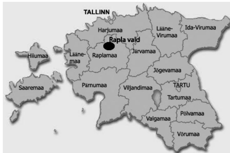
Rapla valla ja Hagudi kandi asukoht Eestis.

Hagudi kant asub Põhja- ja Kesk-Eestis Raplamaa põhja-keskosas, Rapla valla põhjaosas.