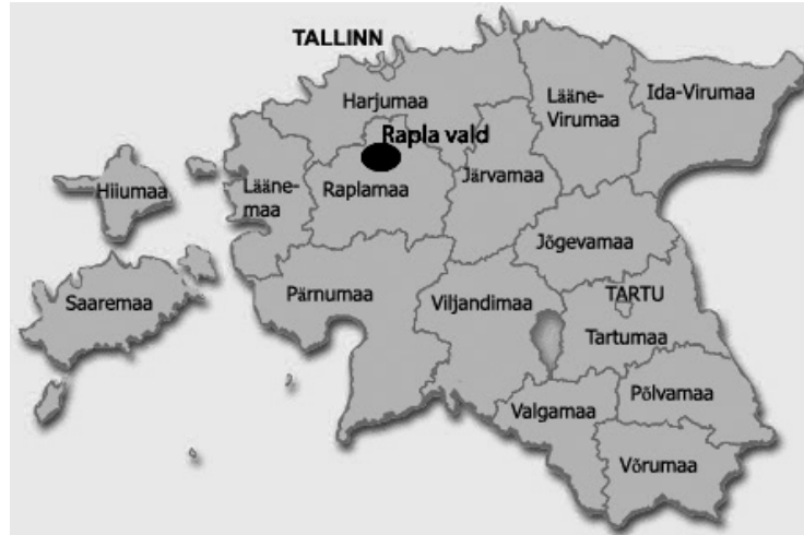
Rapla valla ja Kodila kandi asukoht Eestis.

Kodila kant asub Põhja- ja Kesk-Eestis Raplamaa keskosas ja Rapla valla lääneosas.