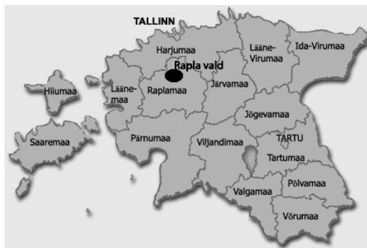
Rapla valla ja Kuusiku kandi asukoht Eestis.

Kuusiku kant asub Põhja- ja Kesk-Eestis Raplamaa keskosas ja Rapla valla lõunaosas.