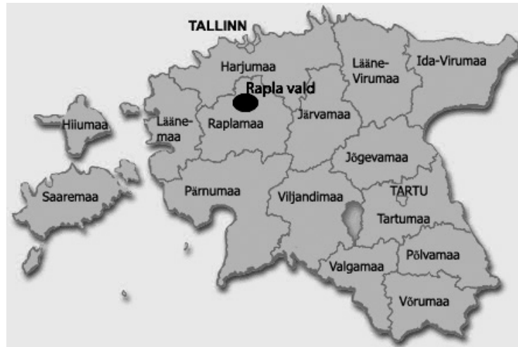
Rapla valla ja Rapla kandi asukoht Eestis.

Rapla kant asub Põhja- ja Kesk-Eestis Raplamaa ja Rapla valla kaguosas.