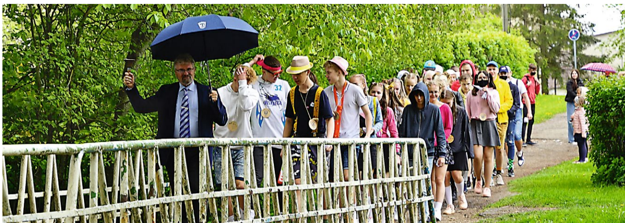
Esimese silla ületamine.