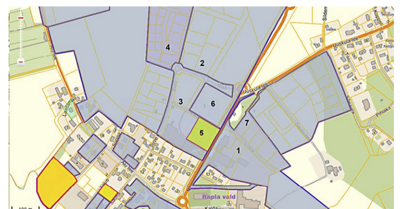
PUUDUTATUD PIIRKONNAS ANTUD EHITUSÕIGUSE ALUSDOKUMENTIDE LOETELU:

huvid ja elluviimisest huvitatud, kutsume puudutatud maaomanikke ja kõiki huvilisi osalema Koguduse planeeringuala küsimuste avalikul arutelul, mis toimub 17. juunil algusega kell 15 Rapla Vallavalitsuse saalis (Viljandi mnt 17 II korrusel, Rapla linn).