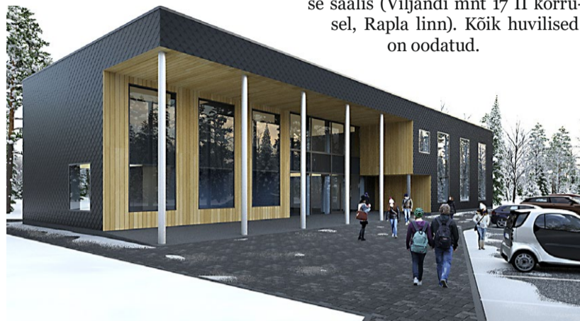
Muusikakooli hoone eelprojekt (autor arhitekt Peeter Varrak, Hirvesoo Arhitektibüroo)

Detailplaneeringu eskiisi avaliku väljapaneku tulemuste avalik arutelu toimub 20. juulil algusega kell 16 Rapla Vallavalitsuse saalis (Viljandi mnt 17 II korrusel, Rapla linn). Kõik huvilised on oodatud.