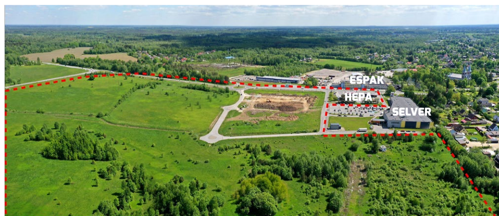
Kriipsjoonega on näidatud Koguduse planeeringuala tinglik piir.

Rapla linna põhjapoolne osa kahel pool Tallinna maanteed ja Uusküla on muutunud tiheda ehitustegevuse piirkonnaks, kus mitmed kehtivad planeeringud ning mõnikord ristuvad huvid põhjustavad maaomanike seas hõlpsasti erimeelsusi. Maa-alal kehtivad lisaks Rapla valla üldplaneeringule 2006. aastal kehtestatud Linda ja Tuuslari tänava detailplaneering, 2008. aastal kehtestatud Koguduse, 2011. aastal kehtestatud Põhjakeskuse ning 2017. aastal kehtestatud Sügise ja Suve tänava elumuala detailplaneeringud. Tallinna mnt 2 maaüksusele on detailplaneering algatatud 2017. aastal ning tänavu alustas Transpordiamet Tallinna maantee ümberprojekteerimist. Lisaks on ehitusõigust mitmel krundil täpsustatud projekteerimistingimustega. Kas kehtival kujul on kõik detailplaneerin-